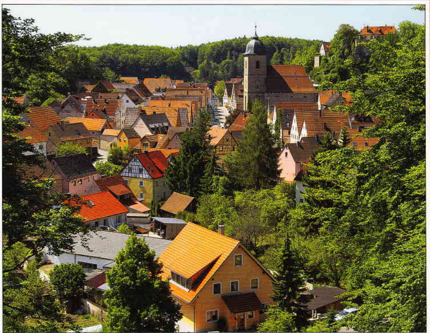
Betzenstein: „23. Heimattag der Fränkischen Schweiz“

Zeitschrift für Mitglieder und Freunde des Fränkische-Schweiz-Verein e.V.