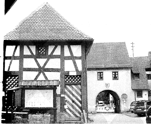
Bild 2 – Das Brunnenhaus des Tiefen Brunnens (links) neben dem Bayreuther Tor in Betzenstein.