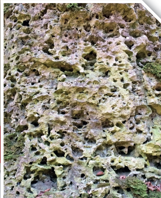
Bild 3: Stark zerlöcherter Oberfläche eines Dolomitmäulen am Ostrand des Hummerstales. Sie entsteht durch Inhomogenitäten der Gesteinsbindung im Dolomit (27.10.2018)