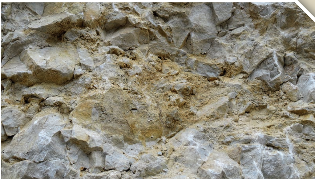
Bild 8: Dolomittfels östlich Siegmansbrunn mit gelblichem Nest aus Dolomitsand (27.10.2018).

folgt. Viel schöner sieht man eine solche Terrasse wenig später ( Punkt 6 ) rechterhand vom Weg. Sie zieht quer durchs Tal nach Osten zu einem Hochsitz ( Bild 4 ).