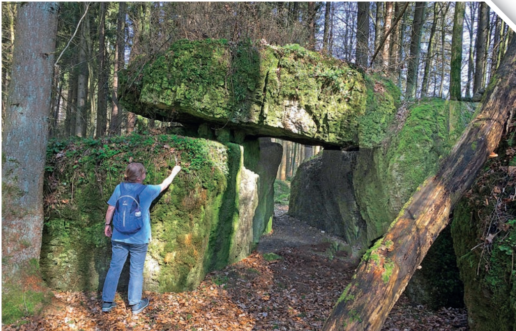
Bild ⑩: Oberes Gleitstein-Felsentor aus Dolomit am Ostrand des Hummersgrabens (19.03.2020)

Im Hummersgraben kann man die stets zunehmende Verengung und Versteilung erleben. Außerdem begegnen wir drei Felsentoren. — Noch vor dem steinernen Brücklein ( Punkt 13 ) zieht ein Fußpfad weiter grabenabwärts. An einem Baum mit Markierungszeichen rechts auf schmalen Pfad abbiegen. Nach 25 m sieht man rechts über dem Tal ein Felsentor ( Punkt 14 ). Vorsichtig den kleinen Graben (im großen Hummersgraben) zum Tor hinüber queren. Es handelt sich um ein Tor, das durch Aufgleiten eines Decksteines entstanden ist, ein Gleitsteintor (Bild ⑩). Es sieht aus wie vom Menschen angelegt; aber Größe und Gewicht der Felsen erlauben das nicht. Der Gleitstein ist von höherer Lage her in diese Position geglitten. —