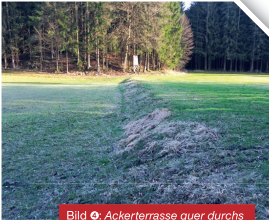
Bild 4: Ackerterrasse quer durchs Hummerstal (6.03.2020).