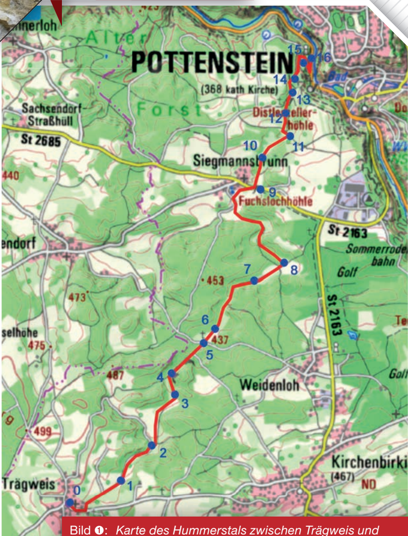
Bild 1: Karte des Hummerstals zwischen Trägweis und Pottenstein. Rot = Wanderweg. Blaue Haltpunkte 1–16. Kartengrundlage: Bayerische Vermessungsverwaltung, geoportal.bayern.de