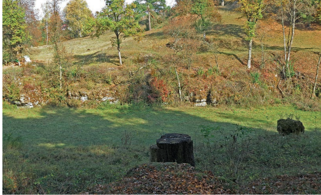
Bild 7: Kastentalform im Dolomit des unteren Hummerstals kurz vor dem Hummersgraben (17.10.2018).

Holzhäuschen. Der Weiterweg auf dem linken Talrand ist zuerst schlecht. Am bald folgenden Feldweg nicht diesem folgen, sondern am linken Talwiesenrand weitergehen bis zu einer etwas bewachsenen Ackerterrassenstufe, über die man am besten ganz im Norden hinabsteigt ( Punkt 10 ). Hier mündet von westlich Siegmansbrunn her ein weites aber kurzes Muldentälchen zum Hummerstal, schneidet aber scheinbar das Haupttal ab, das eigentlich das Haupttal ist — eine anthropogen verursachte höhere Ackerterrasse im Hummerstal durch jahrhundertelange Unterpflügung. Man folgt dem Tal weiter abwärts über eine weitere Ackerterrasse mit Hochsitz bis zu einem Feldweg bald dahinter ( Punkt 11 ). Hier kann man dem Tal nicht weiter folgen, da eine kurze, aber unüberwindbare Stelle mit Doline umgangen werden muss. Man folgt dem Feldweg nach links aufwärts einige Schritte bis zum nahen Heckenende auf der rechten Seite, biegt hinter der Hecke rechts zurück über die Wiese diagonal bergan zum Auftreffpunkt der nächst höheren Hecke auf den Talrand. Dort beginnt ein neuer Fußpfad. Er folgt immer der Westkante über dem Hummerstal, vorbei an schöner Dolomitfelsengruppe ( Punkt 12 ) und wieder hinab gegen das Tal. Von oben schon erblickt man, dass das Tal sich jetzt als Kastental in den Dolomit eingeschnitten hat (Bild 7).