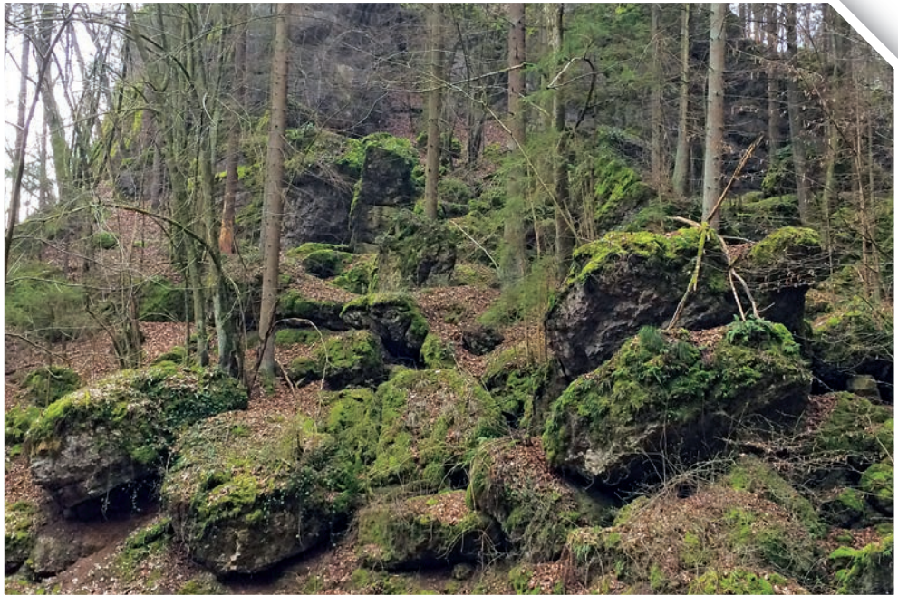
Bild 10: Blockhalde (Dolomit) am Ostrand des Hummersgrabens. Solche Blöcke können derart auf andere gleiten, dass ein Gleitsteintor entsteht (20.03.2020).

einem befestigten Waldsträßchen. Etwas vor dem Sträßchen sieht man rechts gegenüber dem Graben ein weiteres Felsentor. Die Waldstraße überquert den wildfelsigen Graben, beschreibt dann eine große Rechtskurve.