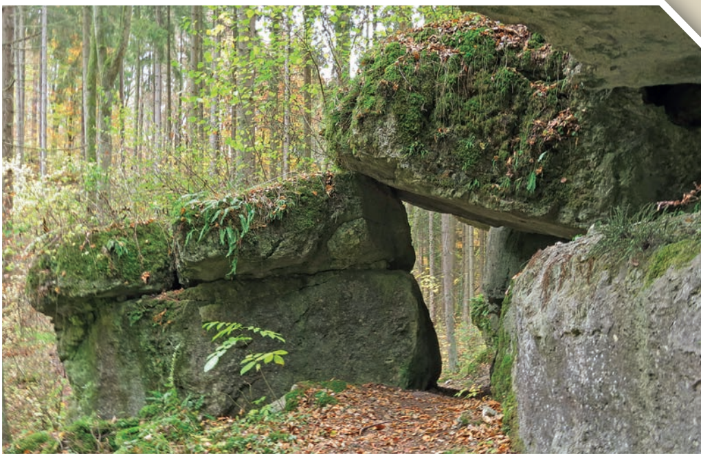
Bild ⑪: Unteres Gleitstein-Felsentor aus Dolomit am Ostrand des Hummersgrabens (27.10.2018)

Wir verlassen den Frankenweg, sobald er wieder hangauf steigend abzweigt, und folgen dem Pfad 50 m talab bis zu