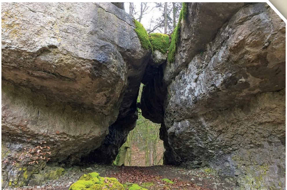
Bild 10: Zwickstein-Felsentor im Dolomit östlich über dem Hummersgraben (20.03.2020)

Dieser Typ eines Trockentals, wie das Hummerstal, kann nicht auf alle Trockentäler der Fränkischen Schweiz und der ganzen Alb angewendet werden. Es gibt dort auch Trockentäler ganz anderer Entstehung.