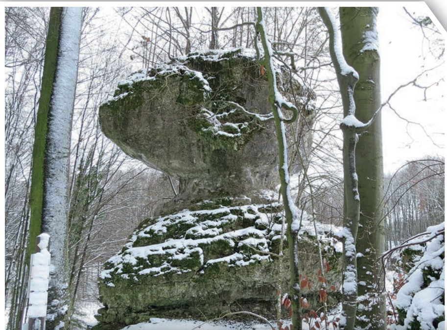
Bild 3: Knopfstein südlich Bärnfels aus härteren, massiven, und weicheren, schichtigen Dolomitlagen natürlich herausmodelliert.