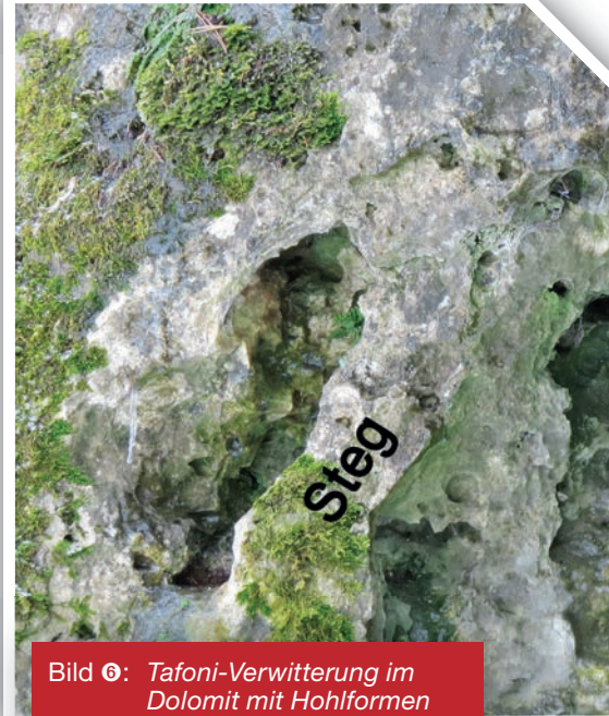
Bild 6: Tafoni-Verwitterung im Dolomit mit Hohlformen hinter harten verbliebenen Stegen. Im Reipersberg nördlich Bärnfels.

Die Fränkische Schweiz, 2013 (3): 16–21.