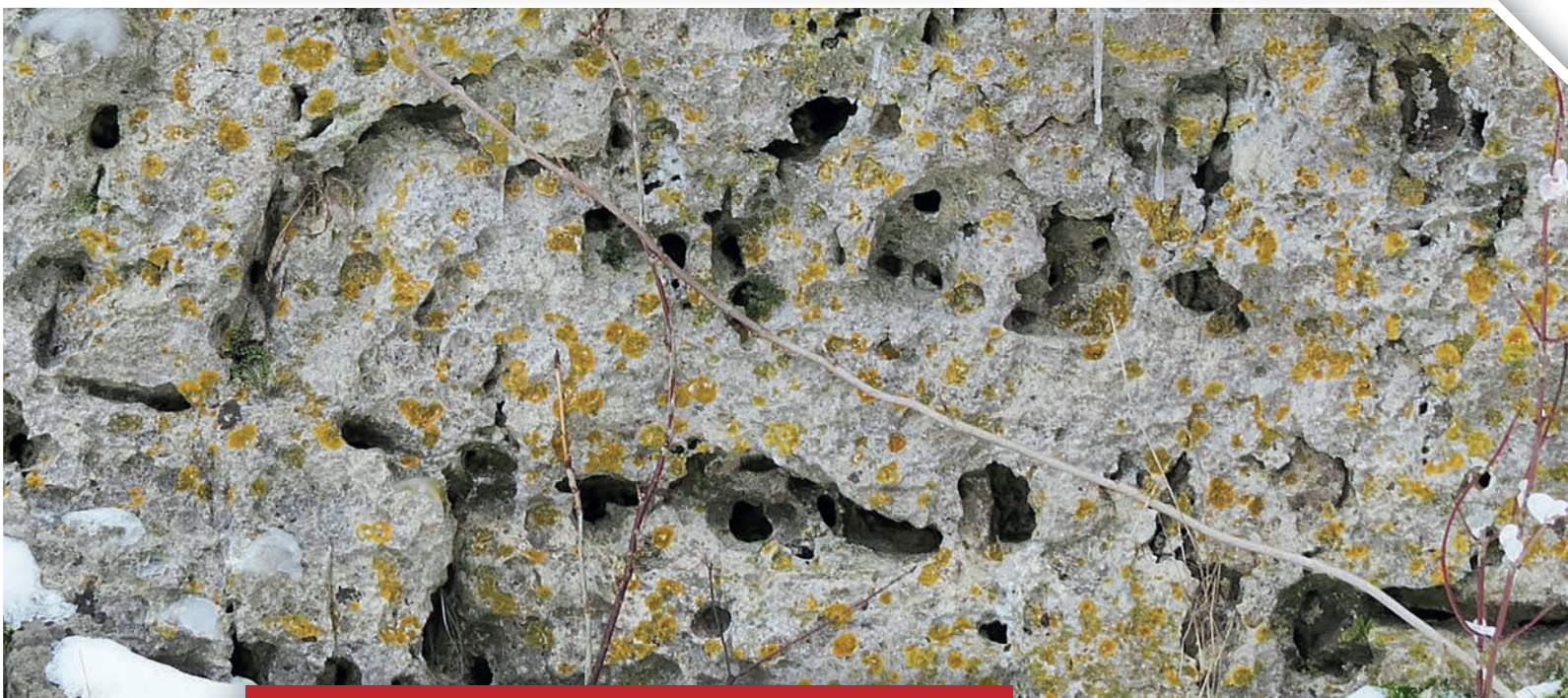
Bild 9: Lochverwitterung im Dolomit am Burgfels · Fotos: Schirmer