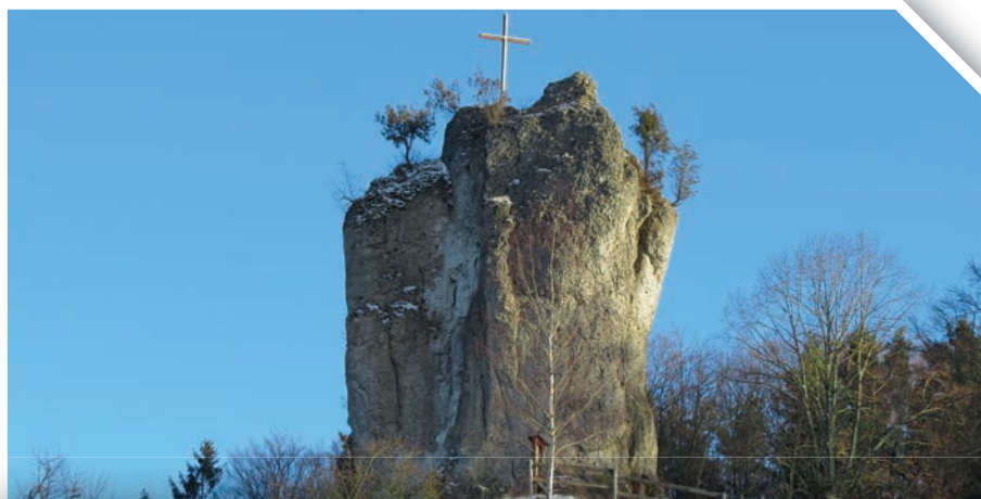
Bild ❶: Der Burgfels (Dolomit) von Bärnfels (alle Fotos: Wolfgang Schirmer, Januar 2019)

Am Burgfels kann man die fortschreitende Zerlegung der Felsen sehr schön sehen: Die Vegetation auf seinem Kopf schützt den Fels (Bild ❶). Seine nackten Flanken sind aber der Aufheizung und der Abkühlung besonders ausgesetzt. So bilden sich Sprünge parallel zu den Felsflanken, längs denen flache Gesteins-