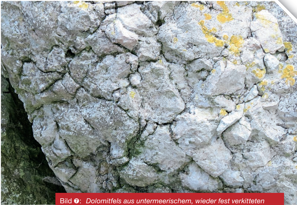
Bild 7: Dolomitmfels aus untermeerischem, wieder fest verkitteten Gesteinsschutt. Bärfels, Burgfels-Massiv. Bildbreite: ca. 1 m