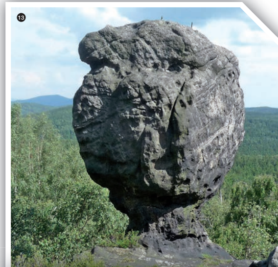
Bild 9: Erneuerte Dolomit-Quackenmauer (2004) um den Friedhof Moggast.

ihren Niederschlag fanden. Sollte ein Leser noch etwas Interessantes beitragen können, bin ich um Mitteilung sehr dankbar (Telefon 0 91 94/72 47 72, E-Mail auf der Titelseite oben).