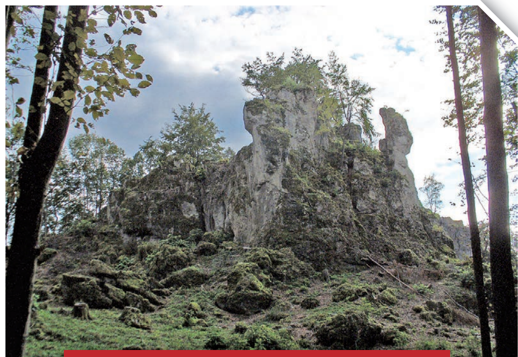
Bild 4: Quackenschloss bei Engelhardsberg (Dolomit). 26.08.2006.

Sprünge, und das bald helle bald dumpfe klingen zu sehen und zu hören.... Ich allein habe gewiß schon 200 hinabspringen lassen, sie fallen dann gewöhnlich in die Wiesent.“