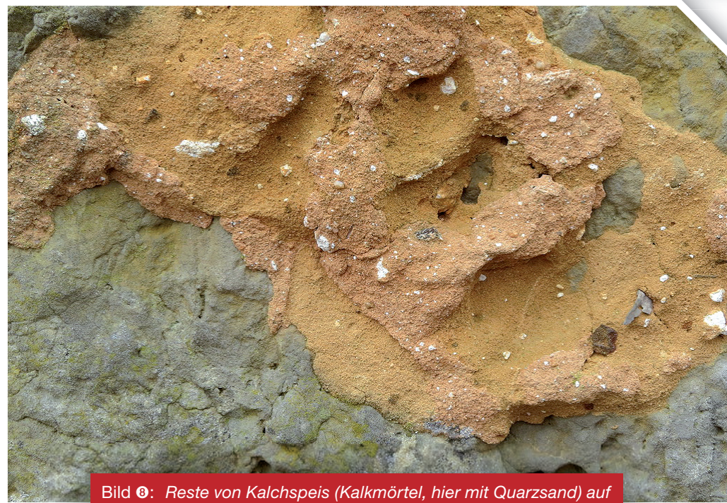
Bild 8: Reste von Kalchspeis (Kalkmörtel, hier mit Quarzsand) auf Dolomit-Quacke. Geschwand. Bildbreite: 28 cm.

solche Ofengrube ist am Knöckel südöstlich von Morschreuth noch erhalten und durch eine Tafel vor Ort erläutert (Bild 7). Als Sandzuschlag wurde je nach Verfügbarkeit Quarzsand oder Dolomitsand verwendet (Bild 8). Quarzsand der Kreidezeit ist vielerorts, besonders im Zentrum der Alb, als Decke unterschiedlicher Dicke verbreitet. Dolomitsand reiht sich überall um die Dolomitkuppen und -knöcke als grusiges Zerfallsprodukt des Dolomits. Natürlicherweise schwinden Quackenmauern immer mehr aus den Ortsbildern. Sie werden durch Putz verdeckt oder beim Umbau ersetzt. Wer den alten Quackenbau zu schätzen weiß, präsentiert ihn auch freigelegt mit neuer Kalchspeis sorgfältig verbunden. Solches geschah zum Beispiel 2004 mit der Friedhofsmauer von Moggast, die Kirche und Friedhof einfriedet (Bild 9). Niedrige Quackenmauern wurden auch ohne Mörtel aufgeschichtet. Solche findet man noch allenthalben auf der Albhochfläche (Bild 10).