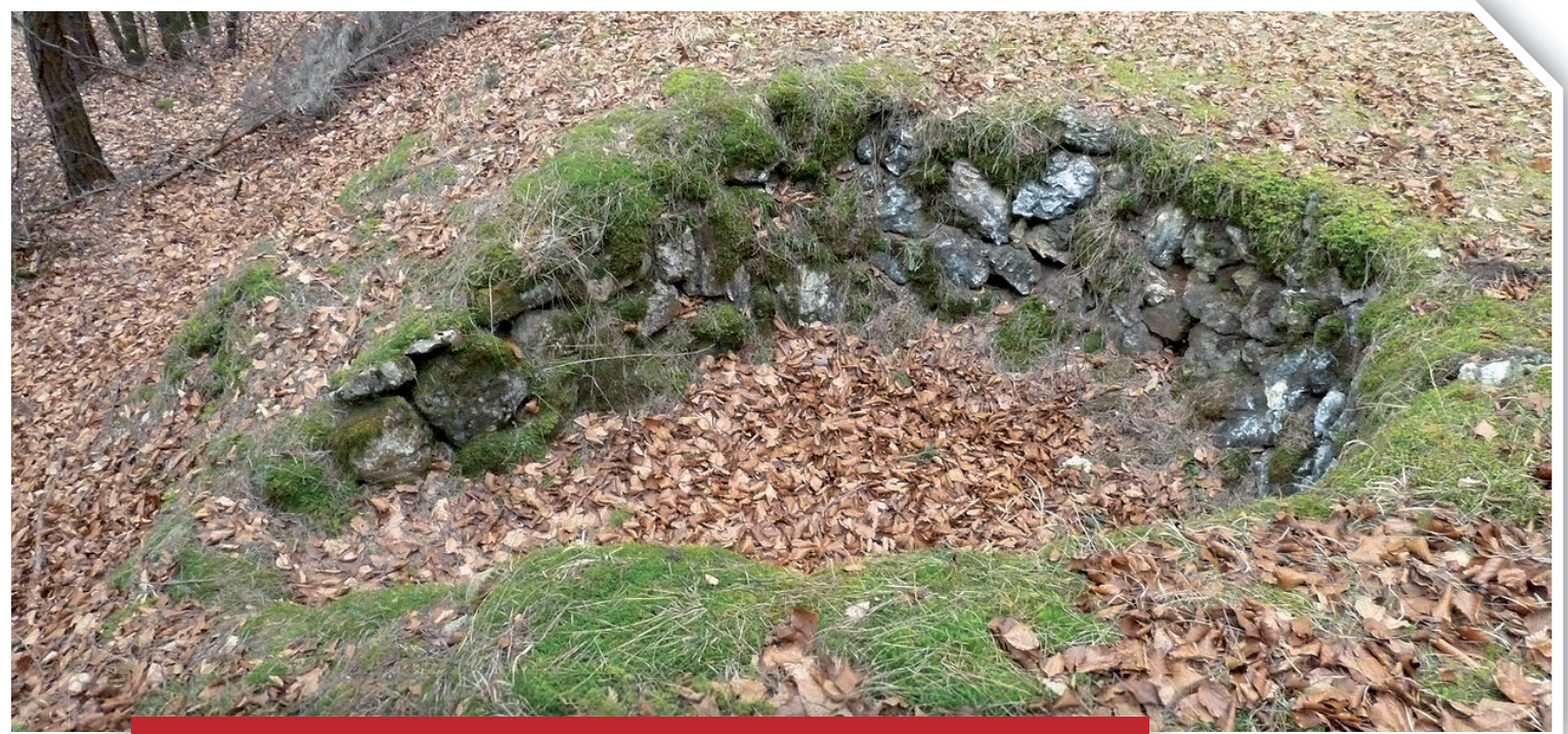
Bild 7: Ehemalige Kalkofenstelle auf dem Knöckel südöstlich Morschreuth. 09.02.2014.