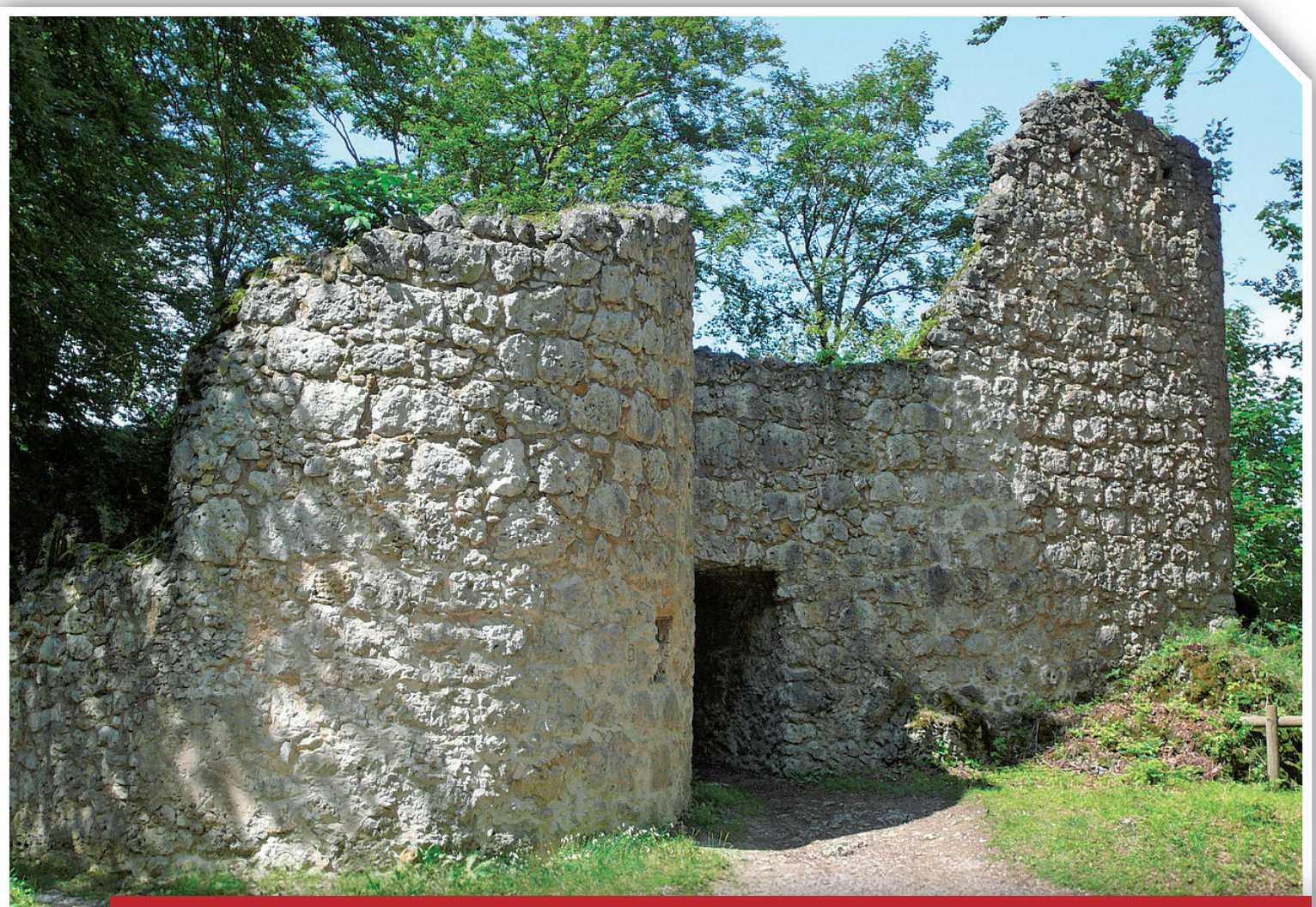
Bild 1: Dolomit-Quackenmauer, Burgruine Leienfels nordöstlich Obertrubach. 08. August 2010..

Gesteinsgrößen. Aber aus vielen über die Fränkische Schweiz verteilten Umfragen ergibt sich: Einen Stein kann man in einer Hand halten, für eine Quacke braucht man zwei Hände. Die größten Quacken lassen sich auch noch mit vier