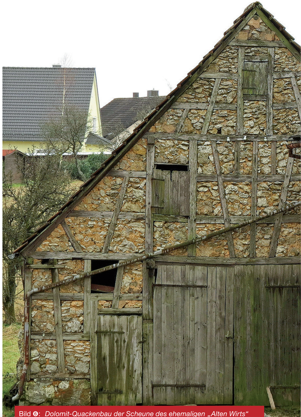
Bild ❷: Dolomit-Quackenbau der Scheune des ehemaligen „Alten Wirts“ in Geschwand Nr. 154. Unterbau wie auch Gefachefüllung aus Quacken. 08. Januar 2018.

Um diese annähernd rundlichen Klötze, gar nicht oder etwas zugerichtet, zur Mauer zu formen, verwendete man Kalkmörtel (gebrannter Kalk + Sand), eine „Kalchspeis“, wie REISELSBERGER 1820 überliefert. Dazu wurde Karbonatgestein in flachen Ofengruben zu Kalk gebrannt. Solche Gruben waren einst überall über die Alb verteilt, so dass nahezu jeder Ort seinen Kalkofen hatte. Flurnamen und Einträge in alten Karten zeugen gelegentlich noch davon. Eine