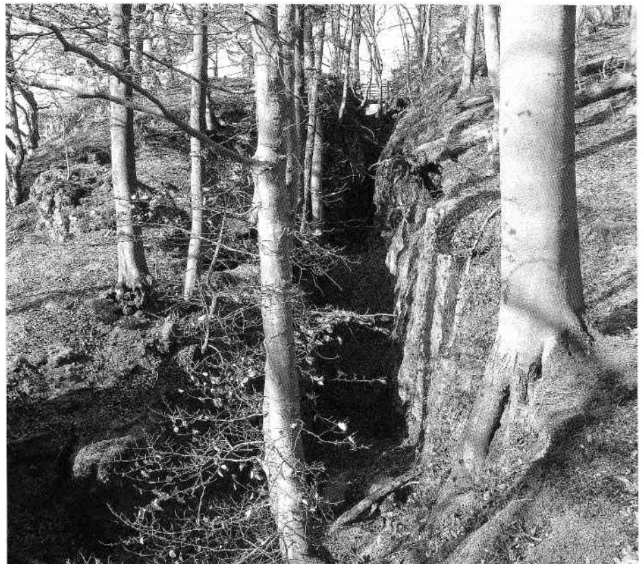
❷ Nackenspalte hinter dem Pfarrfelsen im Trubachtal bei Egloffstein. Die Spalte ist der Beginn eines Risses, an dem sich der Pfarrfelsen vom Gesteinshinterland ablöst, um irgendwann abzustürzen. 6. Februar 2011